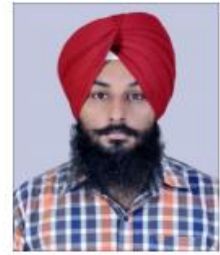
Dr. Jatinder Pal Singh Thapar Institute of Engineering and Technology, India